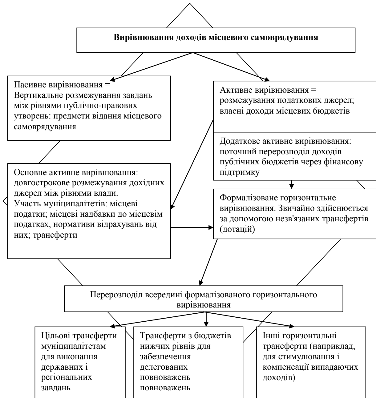
Рис. 1. Напрями вирівнювання доходів місцевого самоврядування

затверджено постановою Колегії Рахункової палати [4]. У Законі України «Про державний бюджет на 2014 рік» [11] не передбачено принципів змін у частині формування взаємовідносин державного та місцевих бюджетів. За рахунок трансфертів з державного бюджету і доходів місцевих бюджетів, що враховуються при визначенні міжбюджетних трансфертів та спрямовуються на виконання делегованих державних повноважень, передбачено сформувати понад 80% доходів місцевих бюджетів.