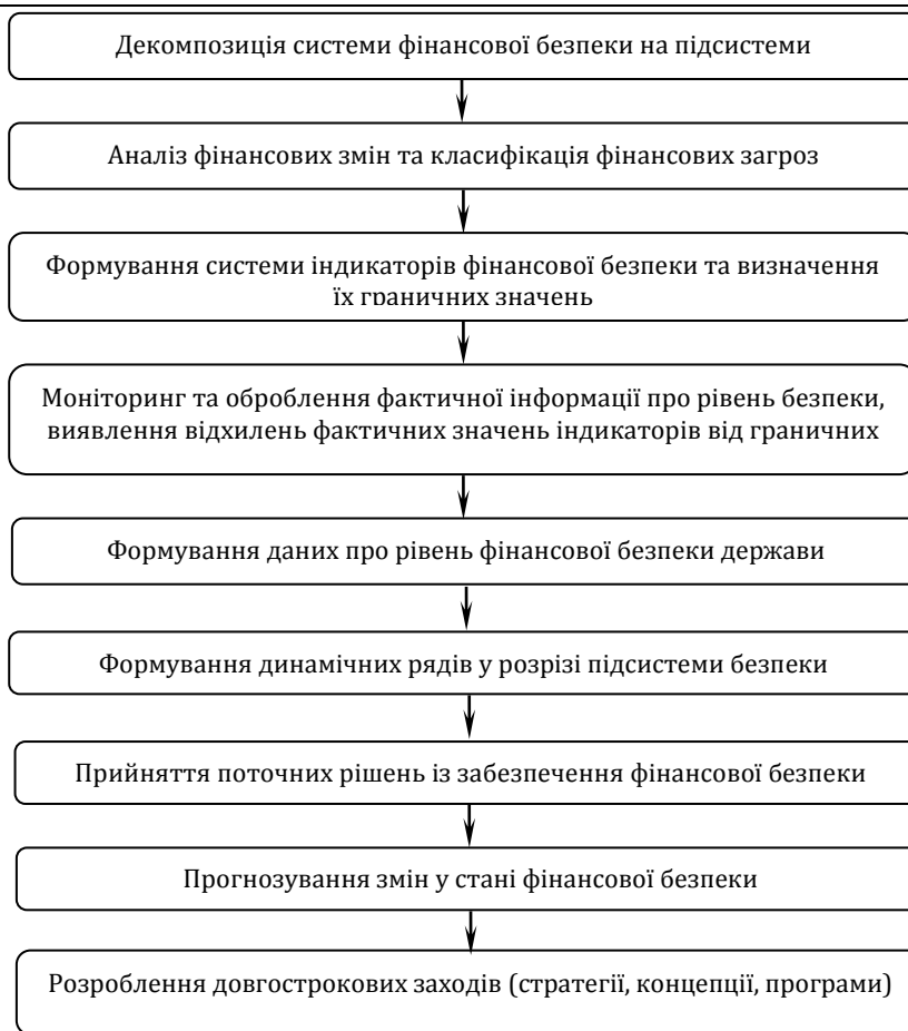
Рис. 2. Алгоритм діагностики та регулювання стану фінансової безпеки

При цьому загальний алгоритм діагностики та регулювання фінансової безпеки повинен містити такі кроки (див. рис. 2).