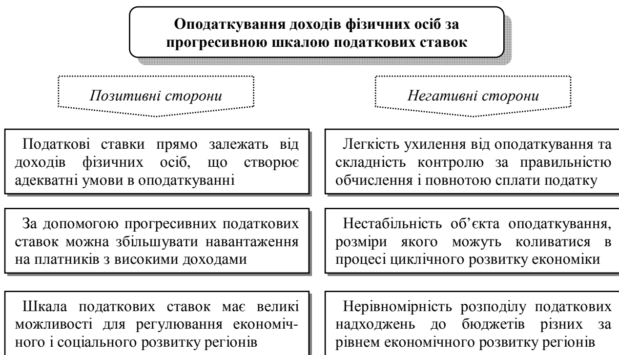
Рис. 2. Позитивні та негативні сторони оподаткування доходів фізичних осіб за прогресивною шкалою податкових ставок

Слід відзначити, впроваджена у 2004 р. пропорційна шкала податкових ставок не вирішила проблему детінізації заробітної плати, що було лейтмотивом реформування в Україні підсистеми оподаткування доходів фізичних осіб. Адже роботодавцю байдуже, за якою ставкою податок буде стягнуто із заробітної плати працівника. Його, передусім, цікавить розмір нарахувань на фонд оплати плати, який піддається значно більшому податковому навантаженню. Відтак у зв'язку зі зростанням соціального розшарування населення необхідно запроваджувати прогресивну форму оподаткування доходів фізичних осіб, за якої податкові ставки збільшуються зі зростанням доходів громадян (її позитивні та негативні сторони узагальнені нами на рис. 2).