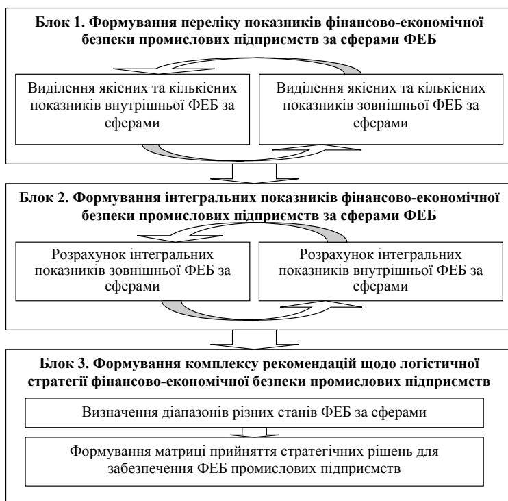
Рис. 1. Етапи формування логістичних стратегій фінансово-економічної безпеки промислових підприємств