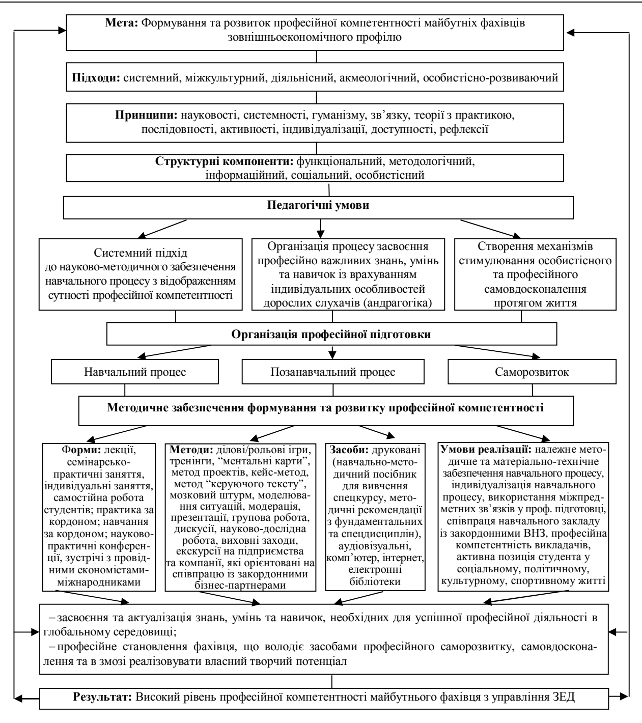
Рис. 2. Модель розвитку професійної компетентності фахівців з управління ЗЕД

Висновки. На сучасному етапі багато українських підприємств активно беруть участь у зовнішньоекономічній діяльності. Проте ефективність цієї діяльності є недостатньо високою – багато підприємств погоджуються на толінгові схеми, за яких здійснюють лише виготовлення продукції на замовлення іноземних партнерів, остерігаючись прямого виходу на ринки розвинених країн із готовою продукцією. Така політика спричиняє втрату прибутковості, оскільки основна маржа прибутку формується на етапі продажу готової продукції. І основна причина такого підходу до здійснення ЗЕД – нестача знань і навичок роботи на ринках інших країн. Тому для підвищення ефективності зовнішньоекономічної діяльності вітчизняних підприємств потрібно розвивати відповідні компетенції персоналу, який відповідає за цю сферу роботи, в т.ч. використовуючи досвід розвинених країн, підприємства яких упевнено почуваються на світових ринках.