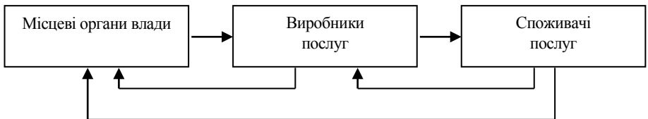
Рис. 1. Система відносин у сфері соціально-комунальних послуг регіону

громадою. Враховуючи, що в існуючій практичній діяльності до комунальних послуг здебільшого відносять послуги, що виробляються інженерно-господарськими структурами з постачання води, тепла і т.п. у дисертації запропоновано термін “соціально-комунальні послуги”. Соціально-комунальними послугами названо послуги, що виробляються і споживаються за місцем проживання або праці населення і здійснення яких відбувається при організаційному, фінансовому тощо сприянні місцевих органів влади. Відповідно, сферою соціально-комунальних послуг регіону названо матеріальні, економічні, правові, інформаційні відносини, що здійснюються у системі відносин між виробниками споживачами та місцевими органами влади (див. рис. 1):