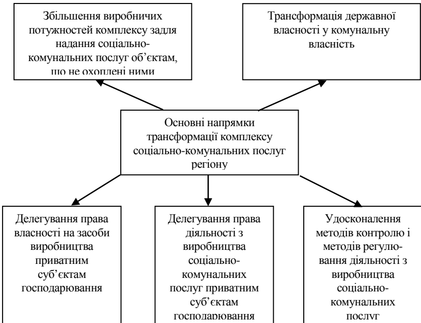
Рис. 3. Класифікація основних напрямків організаційно-економічної трансформації комплексу соціально-комунальних послуг регіону

Для реалізації цієї мети необхідним є проведення трансформації соціально-комунальних послуг регіону. Враховуючи наявність неоднозначності у трактуванні поняття “трансформація” у дисертації на основі аналізу літературних джерел та законів України з проблем впровадження в економіку України ринкових відносин сформульовано визначення наукового і прагматичного поняття “трансформація суб’єкта господарювання”. Трансформацією суб’єкта господарювання (підприємства, галузі, регіону, економіки держави) названо сукупність організаційних, економічних, технічних, технологічних та інших дій, заходів, методів, застосування яких зумовлює перехід від одного етапу виробництва продукції і послуг до іншого (нового, ефективнішого) в межах заданої (традиційної) місії суб’єкта господарювання.