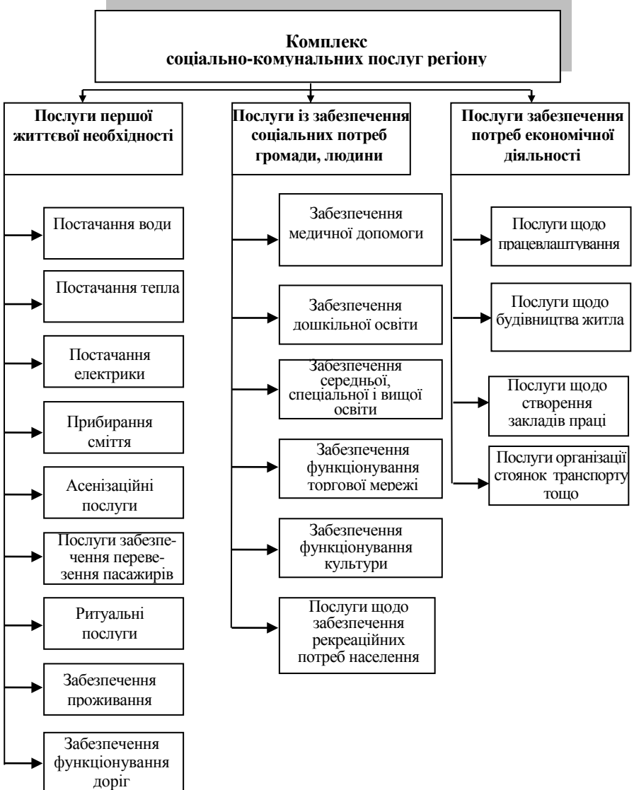
Рис. 2. Класифікація видів соціально-комунальних послуг регіону

Таким чином, об'єктивна необхідність функціонування комунальної власності обумовлена потребою виражати інтереси територіальних громад, та створення умов для децентралізації управління і розвитку місцевого самоврядування. Але інтереси громад можуть реалізовуватись лише тоді, коли є