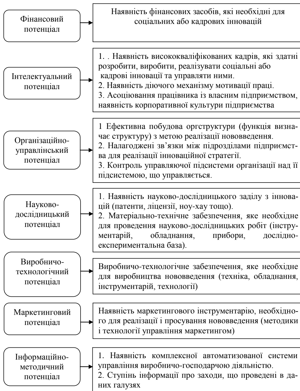
Рис. 1. Структура інноваційного потенціалу, необхідного для ефективного розвитку підприємства [розроблено автором]

методичний потенціал підприємства, які, в свою чергу, будуть впливати на мотивацію праці, культуру виробництва, створюючи сприятливі умови для змін у соціальних відносинах як в державі так і на підприємствах зокрема (рис. 1).