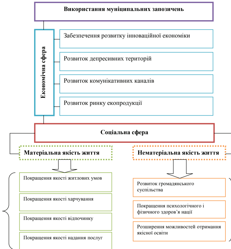
Рис. 1. Прояв ефективного використання муніципальних запозичень

Виклад основного матеріалу. Основною метою випуску муніципальних облігацій є акумулювання коштів для забезпечення економічного розвитку регіону та як результат – покращення матеріальної та нематеріальної якості життя громадян (рис. 1).