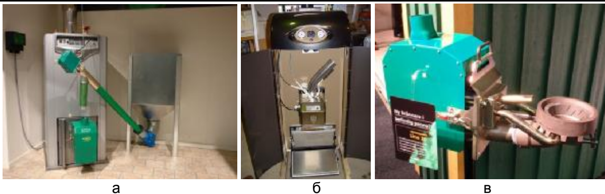
Рис. 4. Види котельного устаткування

а – універсальний котел із пелетним пальником і бункером для пеллет, б – автоматичний котел із пелетним пальником, в – пеллетний пальник.